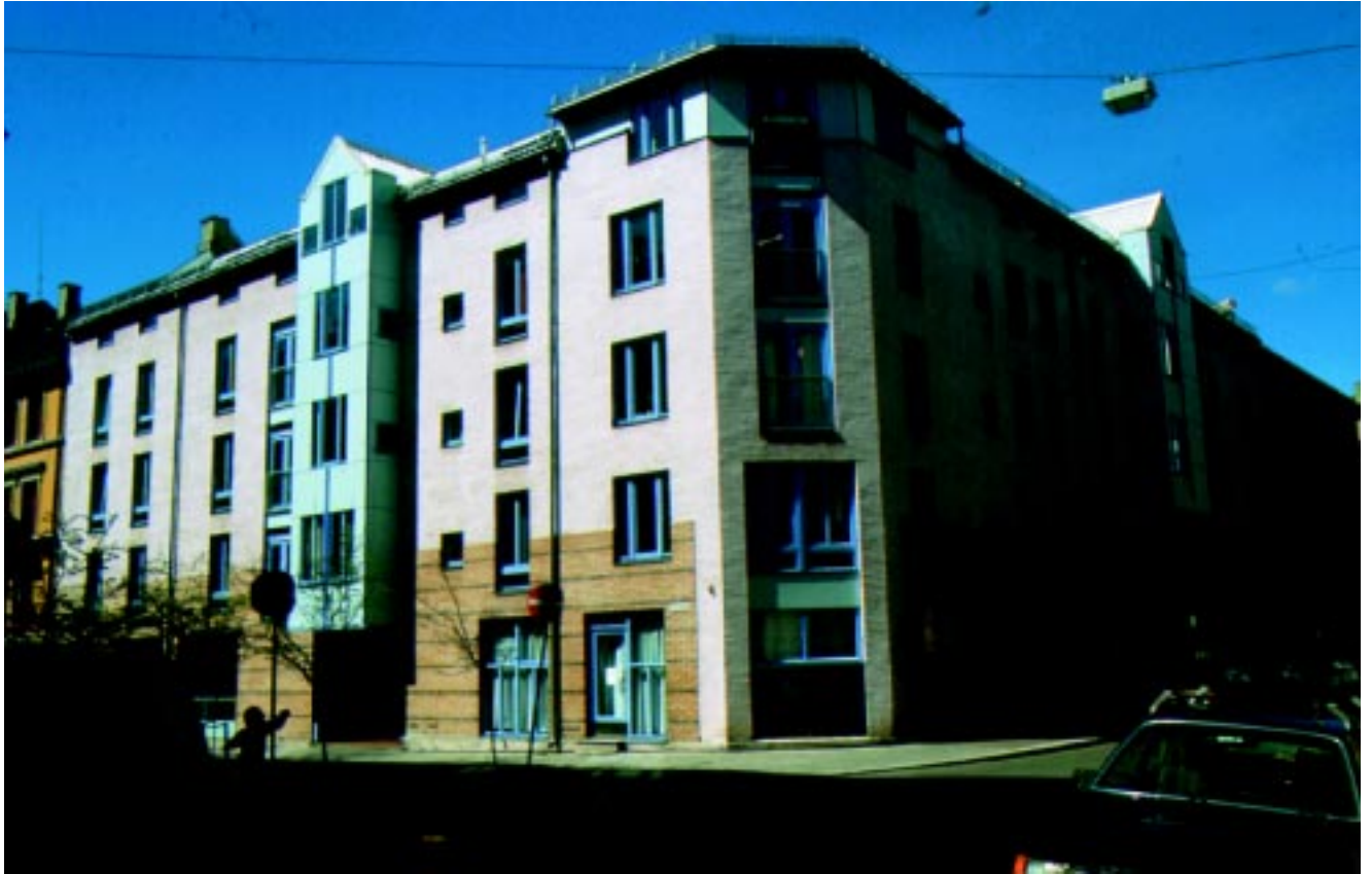
Fra gårdsrommet